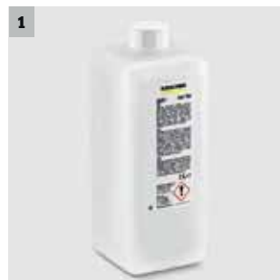
Biologisch abbaubares Reinigungsmittel aus Getreideextrakt

Ärgerlichen Kaugummirückständen rücken Sie mit unserem Dampfreiniger SGG 1 besonders effektiv und umweltschonend zu Leibe. Eine Kombination aus Dampf und biologisch abbaubarem Reinigungsmittel löst angetrocknete Kaugummis einfach ab – und das in wenigen Sekunden. Umso länger hält der Akku des komfortablen Rucksacksystems: Rund 8 Stunden garantieren lange Arbeitseinsätze.