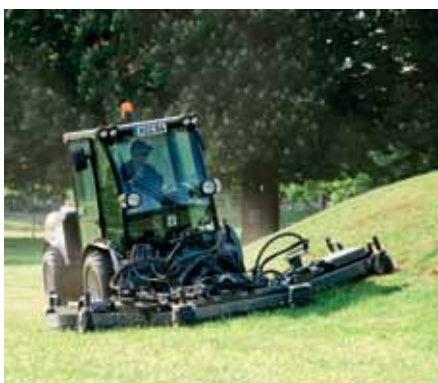
MIC 84, Sichelmäher