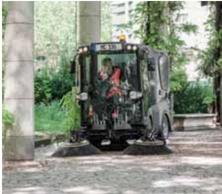
MC 130, Kehren