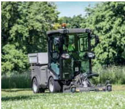
MIC 42, Sichelmäherwerk