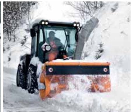
MIC 84, Schneefräse