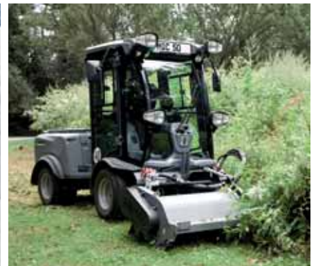
MIC 50, Schlegelmäher