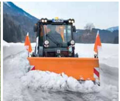
MIC 84, Einschneeschneepflug