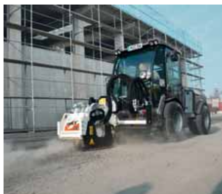
MIC 84, Asphaltfräse