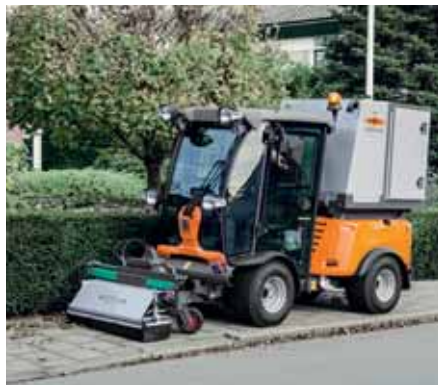
MIC 50, Wildkrautbeseitigung