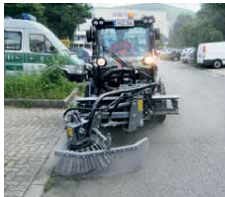
MIC 84, Wildkrautbesen