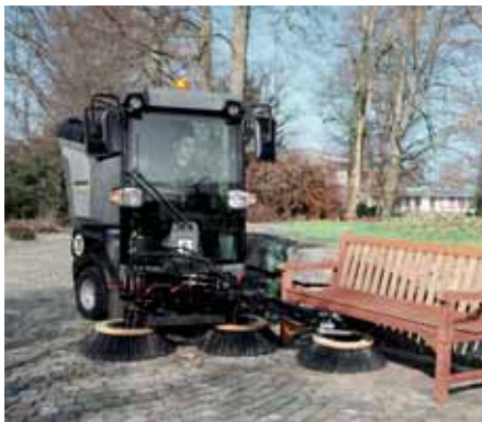
MIC 34 C, Kehren