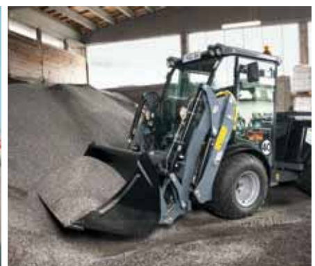
MIC 84, Frontlader