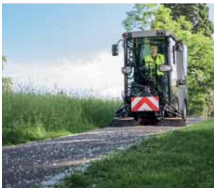
MC 80, Kehrsystem