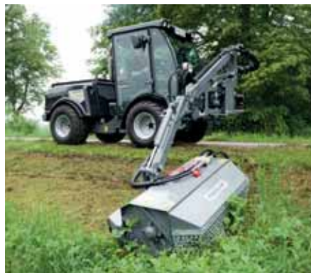
MIC 84, Frontausleger