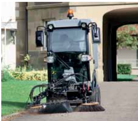
MIC 34 C, Wildkrautbesen