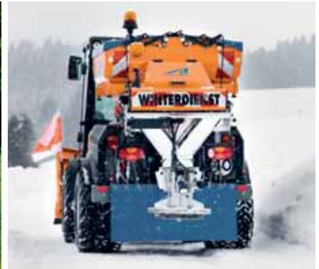
MIC 84, Aufbaustreuer