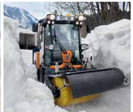
MIC 50, Frontkehrmaschine