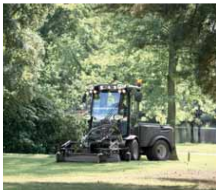
MIC 50, Sichelmäher