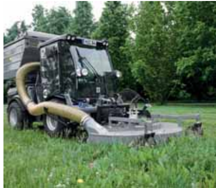
MIC 84, Mäh-Saug-Kombination