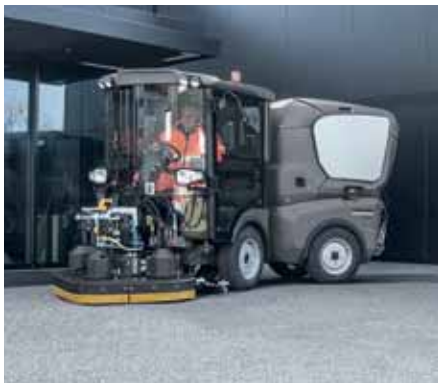
MC 130, Schrubbdeck