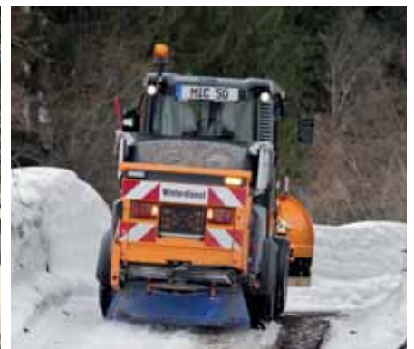
MIC 50, Anhängestreuer