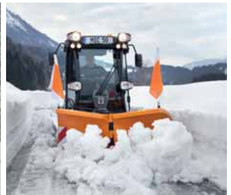
MIC 50, V-Pflug