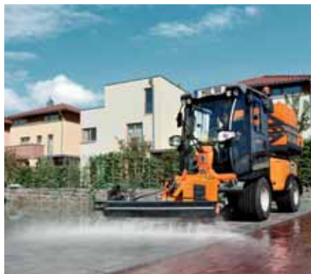
MIC 50, Schwemmsystem