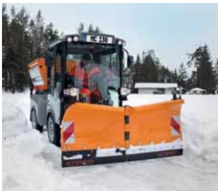
MC 130, Vario-Schneepflug