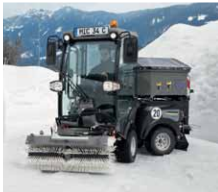
MIC 34 C, Winterdienst