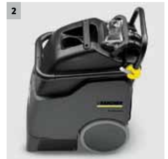
2 Kompakte Abmessungen