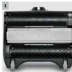
1 2 gegenläufige Walzen

Teppichzwischenreinigungsgeräte entfernen Schmutz und frischen gleichzeitig die Teppichbodenflächen auf, die bereits nach circa 20 Minuten wieder begehbar sind. Flächenleistung: bis zu 300 m 2 /h.