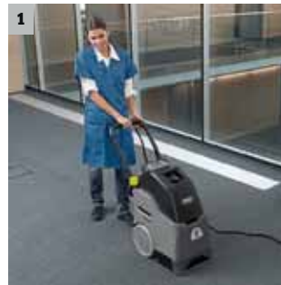
1 Hohe Reinigungsleistung

Sehr einfach in der Bedienung und wirtschaftlich in der Grundreinigung. Mit den zusätzlich erhältlichen Kärcher Hand- und Bodendüsen lassen sich auch sehr schwer zugängliche Flächen fasertief reinigen.