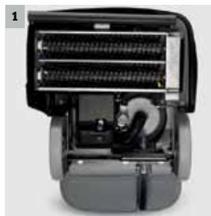
1 Schwebend gelagerter Bürstenkopf mit gegenläufigen Walzenbürsten

Überall, wo es um die wirtschaftliche, großflächige und fasertiefe Teppichgrundreinigung geht, kommen die Teppichreinigungsautomaten von Kärcher zum Einsatz. Sie eignen sich für die herkömmliche Sprühextraktion ebenso wie für die Teppichzwischenreinigung mit dem Reinigungsmittel RM 768 ICapsol. Dabei wird der Schmutz innerhalb von ungefähr 20 Minuten getrocknet und zu Kristallen gebunden. Diese müssen dann nur noch eingesaugt werden.