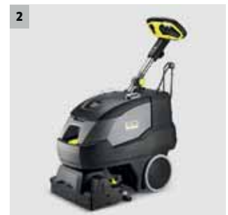
2 Zur Teppichgrund- und -zwischenreinigung