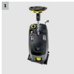
1 200° drehbarer Reinigungskopf

Im Gegensatz zu anderen Teppichgrundreinigungsautomaten kann der sehr wendige BRC 40/22 C dank eines für Vortrieb sorgenden, drehbaren Bürstenkopfs auch vorwärts reinigen und so zusätzliche und ärgerliche Laufwege vermeiden. Dabei spart er im Vergleich mindestens 30 Prozent Zeit ein und erhöht die Produktivität auf ein bislang nicht bekanntes Niveau.