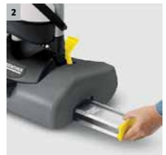
2 in 1