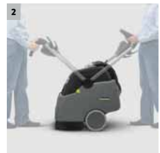
2 Arbeitsrichtung vorwärts oder rückwärts